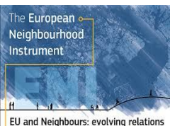
EU and Neighbours: evolving relations